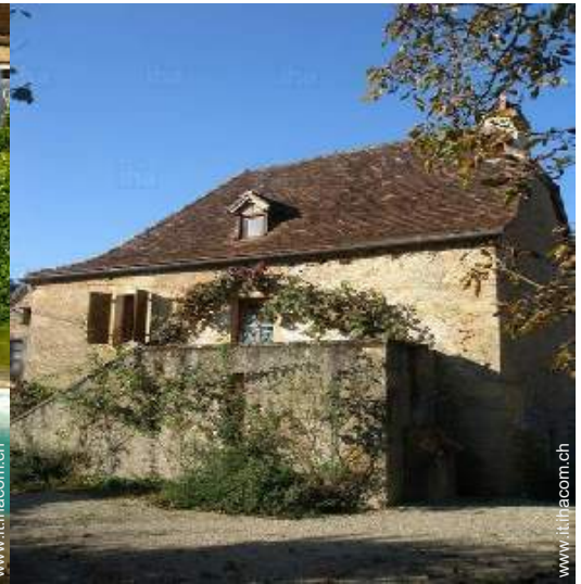
Casa Tipica di Charme