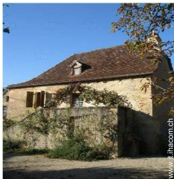
Casa Tipica di Charme