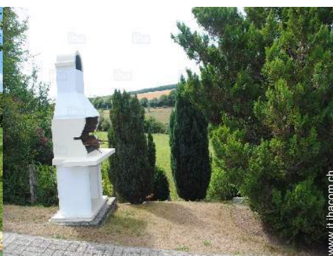
Attrezzature esterne a disposizione degli ospiti