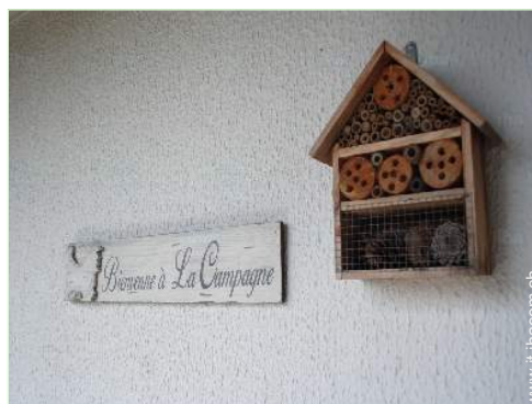
Casa di Campagna