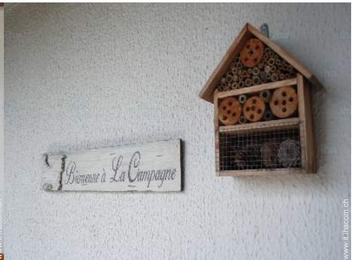
Casa di Campagna