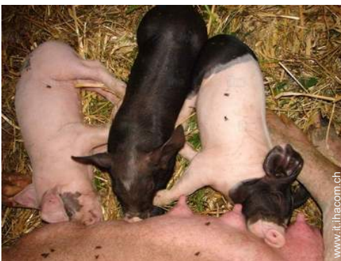
animali da fattoria