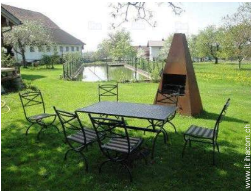
tavolo da giardino