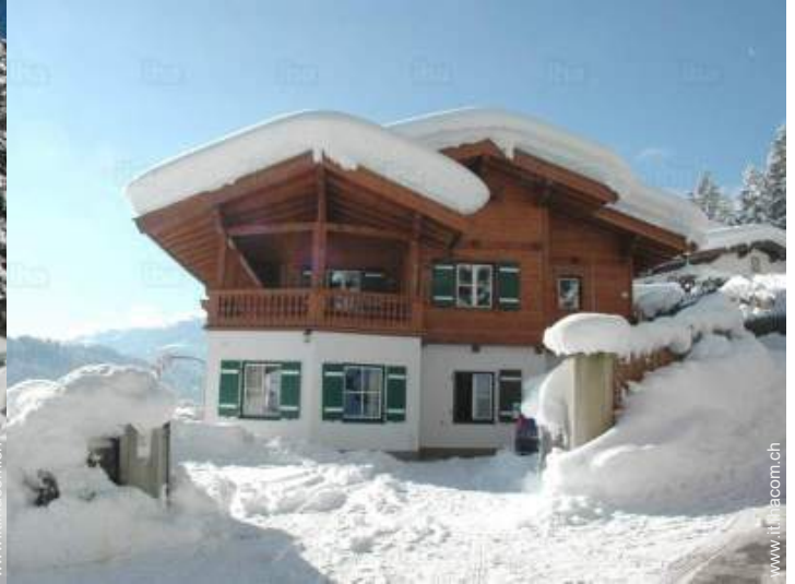
Casa di Campagna di Prestigio