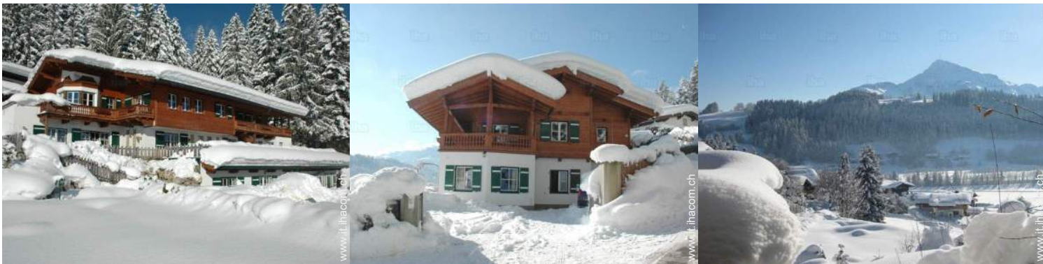
Casa di Campagna di Prestigio