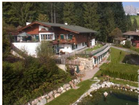
Casa di Campagna di Prestigio