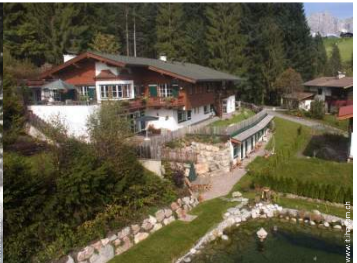
Casa di Campagna di Prestigio