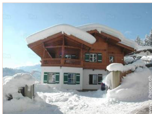
Casa di Campagna di Prestigio