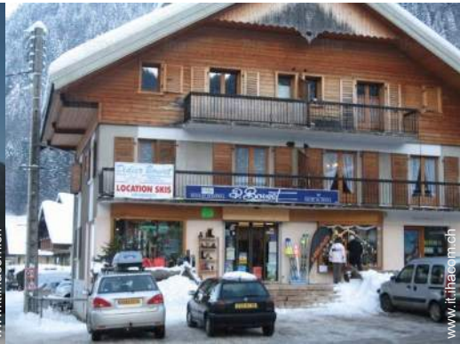
noleggjo attrezzatura di sci