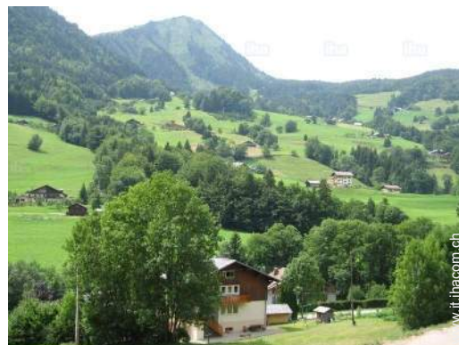
vista sulla montagna