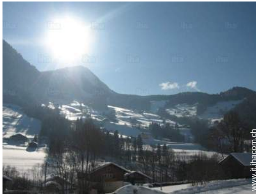
vista dal balcone