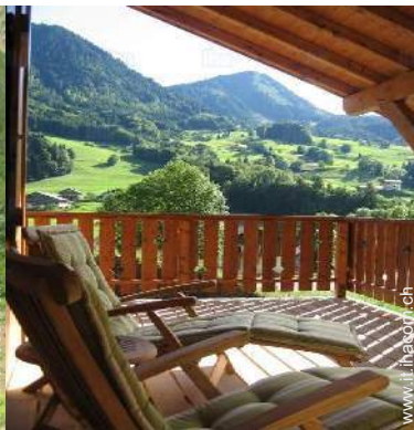
vista dal balcone