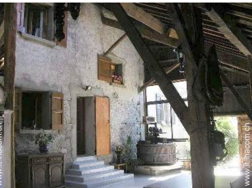
racchetta(e) da ping-pong