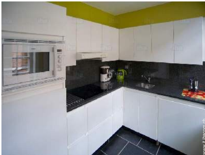
cucina in stile americano