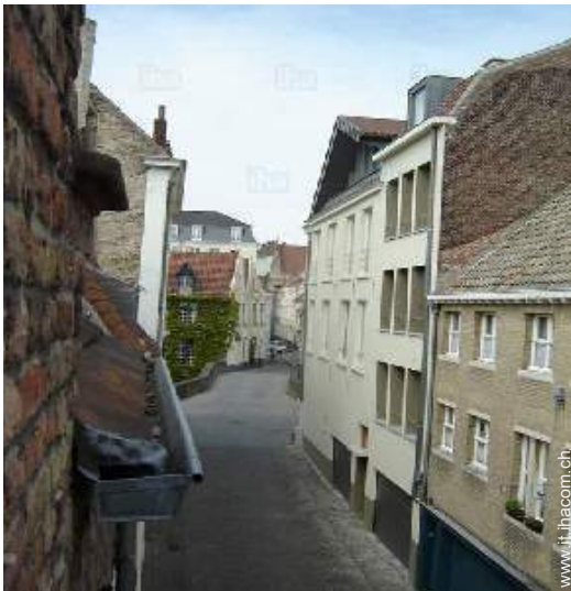
vista dalla camera