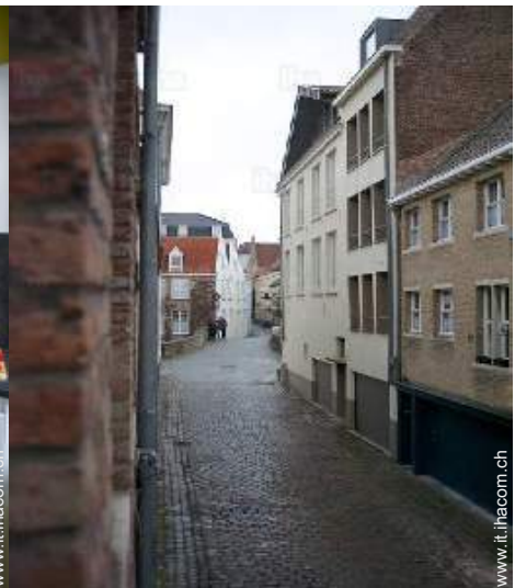
vista dal soggiorno