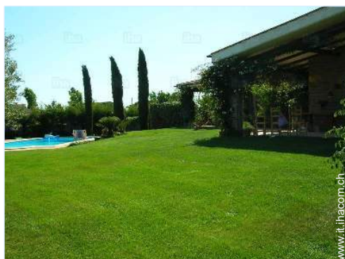
Proprietà di Charme