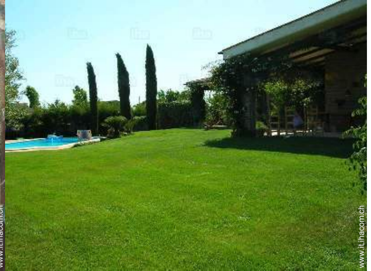
Proprietà di Charme