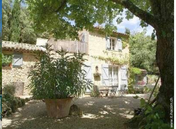
Proprietà di Charme