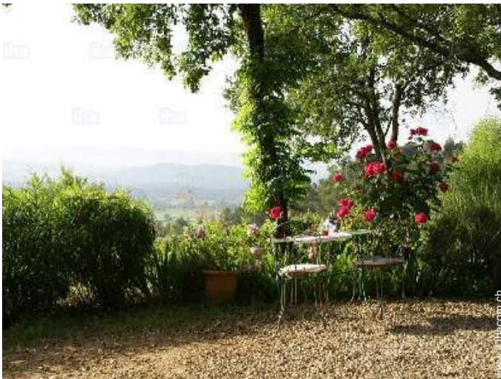
vista dalla casa