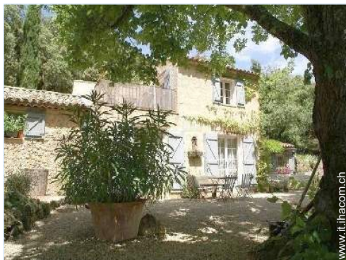
Proprietà di Charme