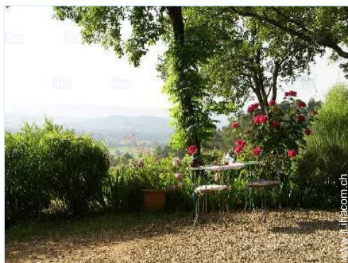
vista dalla casa