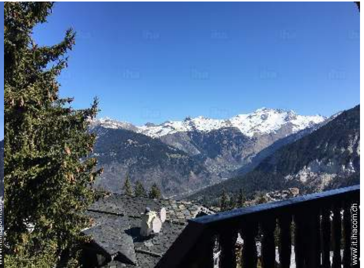
vista dalla proprietà