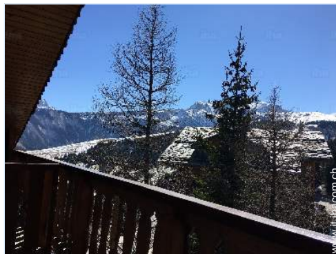
vista dal balcone