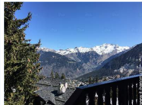
vista dalla proprietà