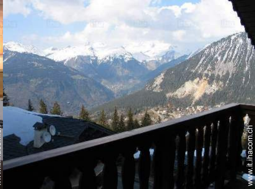
vista dalla camera