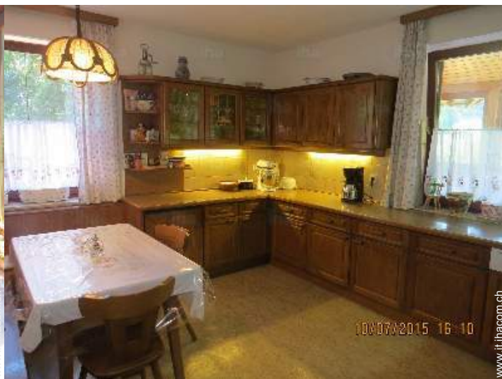
grande cucina indipendente