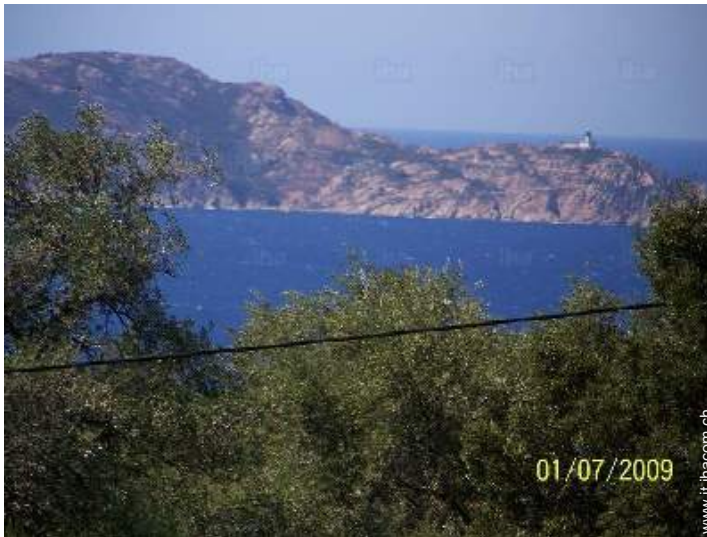
vista sul mare