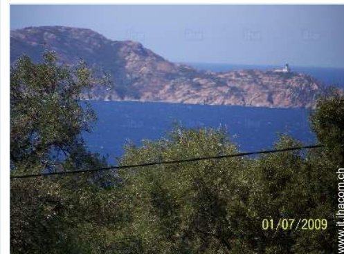
vista sul mare