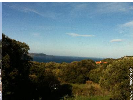
vista dalla casa