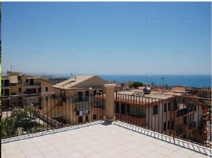
vista dalla veranda