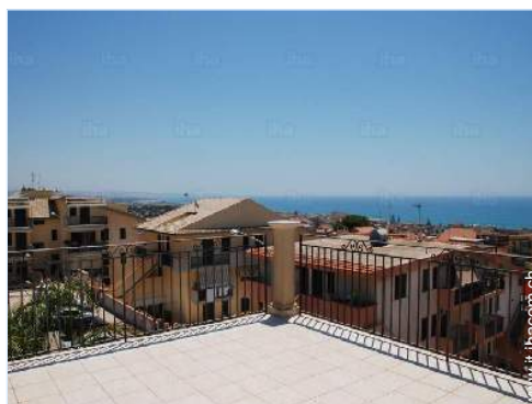
vista dalla veranda