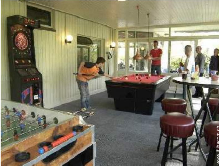
sala dei giochi