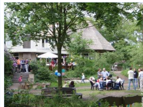
vista dalla proprietà

Internet café 15km Ufficio postale 4km Banca 4km Distributore automatico di biglietti 4km Farmacia 4km Medico 4km Infermiera 4km Ospedale 15km Ambulatorio 15km