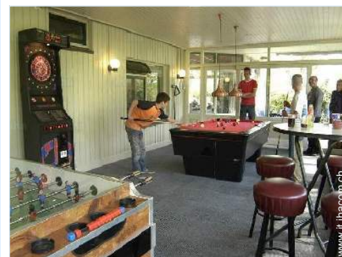
sala dei giochi