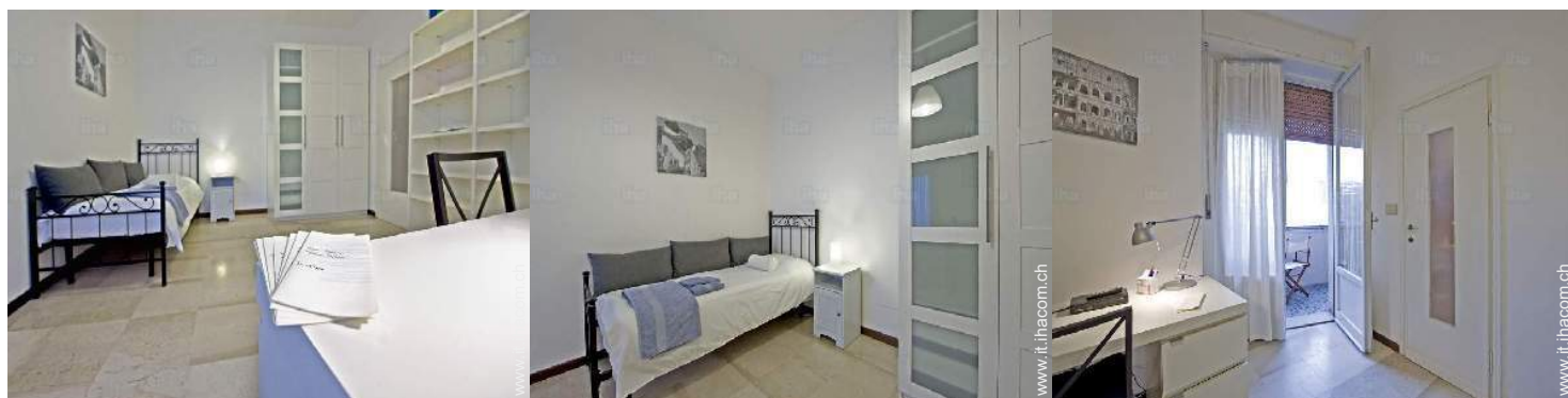
Disposizione interna e comfort