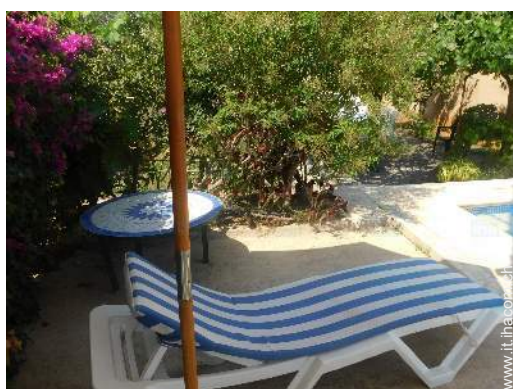
vista dalla piscina