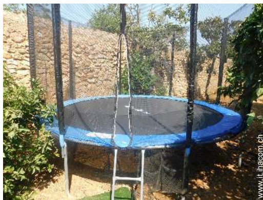
disposizione delle attrezzature ricreative