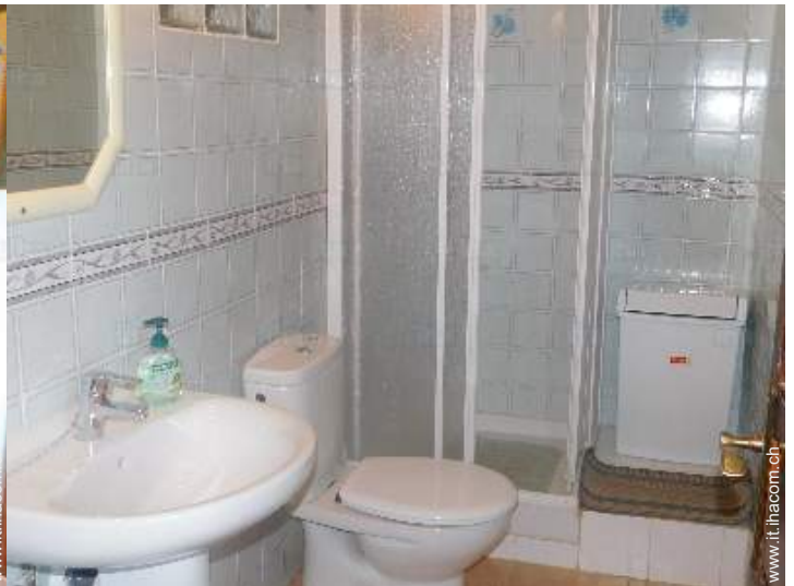
luogo per bagnarsi