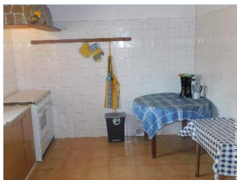
cucina a gas