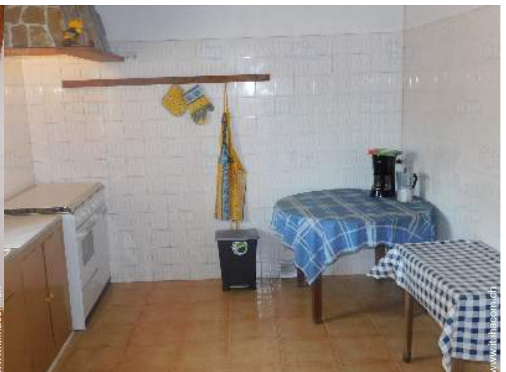
cucina a gas