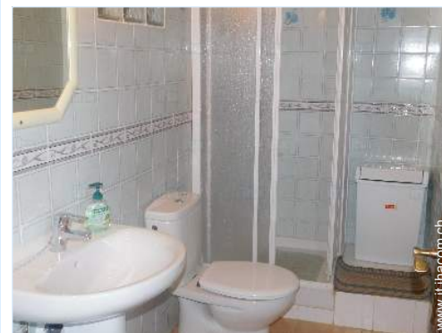
luogo per bagnarsi

Villaggio centro 2km Fermata/stazionamento bus 1km Noleggio auto 5km Panetteria 2km Negozi tipici 2km Supermercato 2km Salone di coiffure 2km Farmacia 2km Medico 2km Ospedale 15km